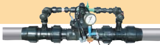
משאבת דישון גבעונית ראש דישון חכם להזרקת כימיקלים "2", "3".

שימוש נכון במערכות ההשקיה יכול לסייע בהתמודדות עם מחלות ופגעים במטע ובמניעת נזק הניגרם על ידי חיפושיות הקפנודיס. כדי להתמודד עם מזיק זה יש לשלב הדברה כימית וממשק גידולי נכון: יש לשמור על סניטציה של כל אזור המטע, לאסוף את החיפושיות ולהשמידן. כמו כן, יש להבטיח השקיה ודישון סדירים (השקיה בהמטרה או בהתזה עדיפה על טפטוף במניעת הנזק), להימנע מפליחת הקרקע, להקפיד על ניקוז יעיל ולהימנע מכל פעולה שעלולה לגרום לעקה ולהחלשת העצים. במטע צעיר לא נושא פרי: ניתן לתת בהגמעה קונפידור או תחליפין, ואקטרה במינונים עולים עם התפתחות המטע. מומלץ לבצע טיפולי מנע לחדירת שורשי העץ לצנרת באמצעות הזרקת טריפלורלין (טרפלן, עד שיצא משימוש) או סטומפ, על פי ההמלצות.