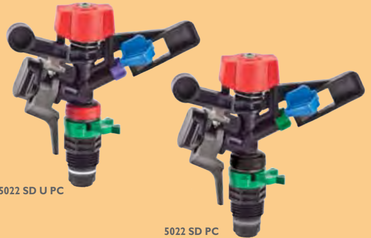
5022 SD U PC

ממטיר פלסטי גיזרתי ללחצים נמוכים SD מפזר חדשני, 1/2", 3/4", מיועד לעמדות השקייה ומערכת עמירית